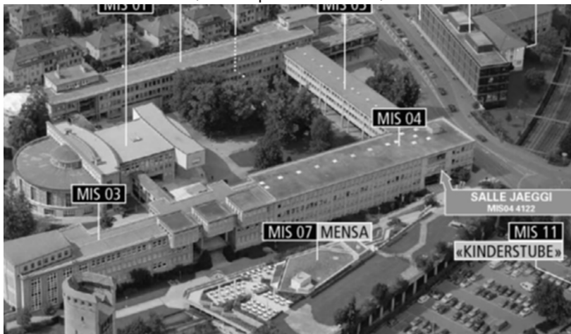
Université Miséricorde, MIS04 4112, Salle Jäggi

Einführungssitzung für neue Philosophiestudierende Mittwoch, 16. September 2015, 17.15 Uhr